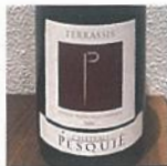
2,100円 ヴァンファン ツカモト 輸入元/飯田