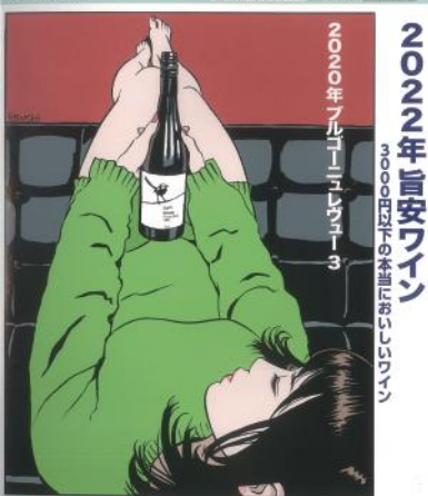
リアルワインガイド VOL.80